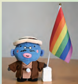
我孫子市マスコットキャラクター 手賀沼のうなぎちゃん

6色のレインボーフラッグ (赤・オレンジ・黄・緑・ 青・紫)は、性的少数者の 尊厳を象徴しており、当事 者支援・連帯の気持ちを表 しています。