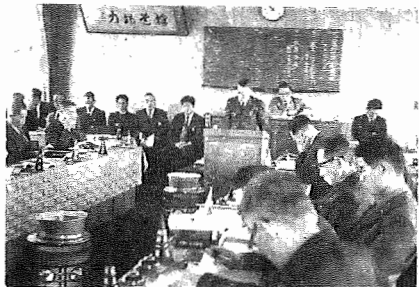
臨時町議会 未了の議案を3月5日から9日までの5日間開かれましたが、最終日の9日午後5時閉会となりました。なお、この臨時町議会には、38年度一般会計追加更正算など21件が提案されました。

はじまる時間 午前 8 時 30 分 おわる時間 午後 5 時 (土曜日 12 時 30 分)