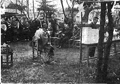
戦没者の慰霊祭 我孫子地区314住の戦没者慰霊祭が、顕彰会のおこしで2月8日、我孫子中学校の魂前でおこなわれました。当日は遺族約240名がバス4台に分乗して、式に参列しました。

す。そこで、ある土地または建物について取引をしようとする人は、まず、その土地または建物の権利関係がどうなっているかを調べてみないと取引の安全がはかれません。このため、登記所では、一定の手数料を納めた人に、登記簿の閲覧を許したり、その謄抄本を交付して一般の便宜を図っています。 ②登記は、民法第一七七条の規定によって第三者に対する対抗要件とされています。たとえば、土地を買った人がその売買によって自分の所有になったことの登記をしておかないと、売主以外の第三者に対して、自分が売買によって所有権を得たと主張できません。 ③もし、取り引きの相手方が登記申請に協力しないときは、裁判所に訴えて登記を命じる判決を得た上で、権利を取得した人が登記を申請することができます。