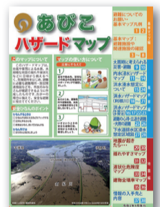
▲令和2年9月発行「あびこハザードマップ」

大地震発生時の最も大きな揺れと建物全壊率などを地域ごとに表示しています。地震への備えの第一歩として、住んでいる地域の特性を理解することが大切です。地震ハザードマップを掲載した「あびこハザードマップ」は、市民安全課、市民課、各行政サービスセンターで配布しています。また、市ホームページ(QRコード参照)からダウンロードできます。