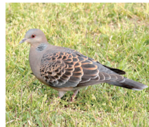
▲日本で最も身近な鳥の一つであるキジバト

視聴方法 鳥の博物館ホームページ(QRコード参照)に掲載のリンクから動画サイトで配信