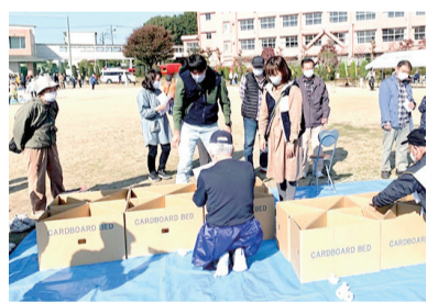
▲久寺家地区6自治会合同防災訓練の様子

近隣住民がお互いに被災者の救出・救護、出火防止、避難誘導を行うことで被害拡大を防止できます。