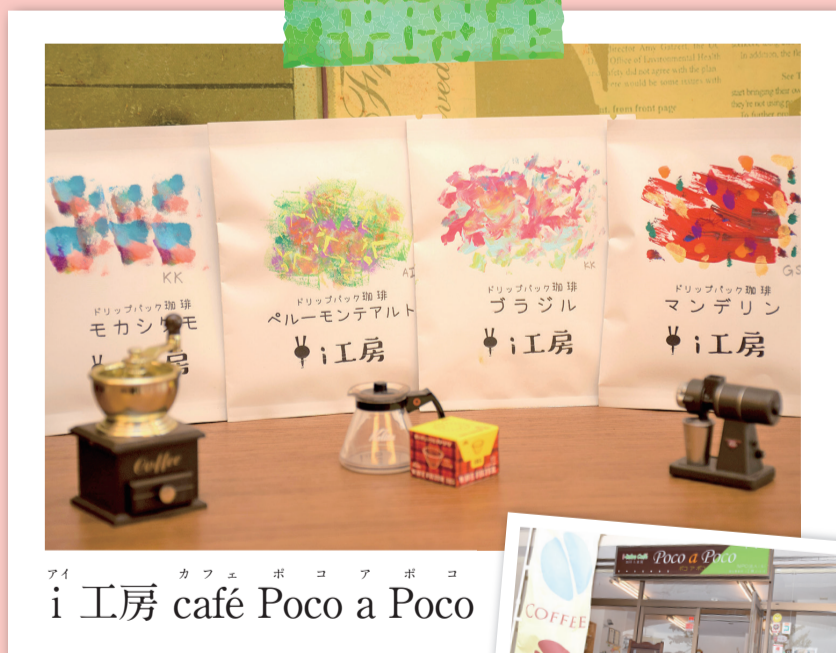
アイ カフェ ポコ ア ポコ i 工房 café Poco a Poco