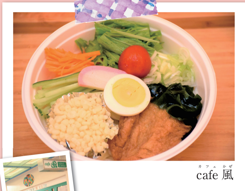
カフェ かぜ cafe 風