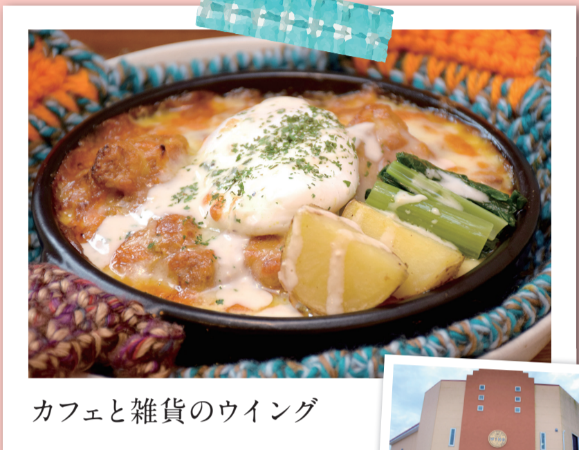
カフェと雑貨のウイング