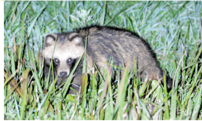
▲利根川の河川敷に生息するタヌキ

ミュージアムインフォメーション 鳥の博物館 Abiko City Museum of Birds 234-3 Konoyama Abiko