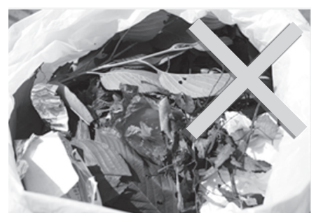
生ごみや紙くすなどをまぜないでください