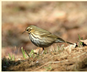
文 塩田いつみ(鳥の博物館)

我孫子では秋~春に斜面林や緑地でときどき見られます。頭から尾までの上面は緑褐色で、黒い縦斑があります。ハクセキレイと同じセキレイの仲間で、他のセキレイ類と同様に尾を上下に振り、地上では両足を交互にして歩行します。主な食べ物は昆虫で、ガやチョウの幼虫、ハエ、甲虫、草の種子を食べています。くまなく地上をさがしまわったり、枝にそって歩いて餌をさがしています。ある調査では胃の中にたくさんのゾウムシが入っていたそうです。山地へ移動して繁殖しますが、春の暖かな日には我孫子でもピリリリピピピピピチなど長く続けてさえずりが聞けることがあります。