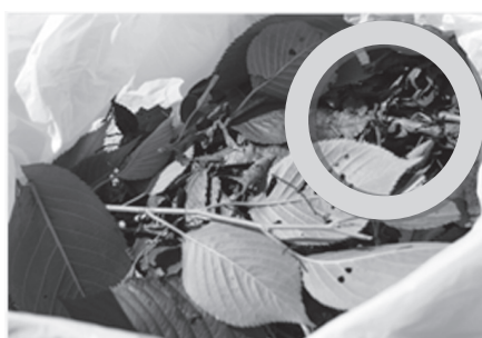
草と葉のみを袋に入れてください

焼却灰の放射能濃度を下げするため、昨年6月から市民の皆さんのご協力により雑草や落ち葉の分別収集を実施しています。 しかし、焼却灰の放射能濃度は現在も低い数値とは言えない状況です。原因として、未だ可燃ごみの中に小枝や落ち葉、土の付いた雑草が混入していることが考えられます。更なる分別の徹底をお願いします。 我孫子市には、焼却灰を処分する中間処理施設や、最終処分場がありませんので、焼却灰の処分は他市・他県に頼らざるを得ない状況です。焼却灰の放射能濃度が高いと焼却灰の搬出・処分ができなくなるため、焼却を停止せざるを得なくなり、可燃ごみの収集ができません。ご協力をお願いします。 ◎収集日と出しかた 地区の収集日は、「平成25年度版あびこクリーンカレンダー」をご覧ください。収集日は、2週間に1回、剪定枝木と同じ日で、紫色の表示です。 ◎雑草や落ち葉、はがした芝は、土をよく払って半透明の袋に入れてください。庭や家庭菜園など、市内の屋外にあったものが対象です。 ◎紙くず、ゴム手袋、空き缶、植木鉢、ラベル、たばこの吸い殻などの可燃ごみや土は、絶対に入れないようにお願いします。