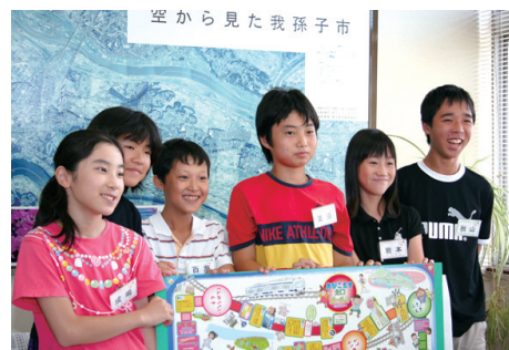
▲平成24年度アビコ・スゴロク完成の記者発表の様子

円 子ども支援課・内線497、✉machitan@city.abiko.chiba.jp