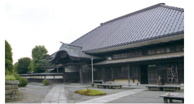
図 教育委員会文化・スポーツ課 ☎7185-1583