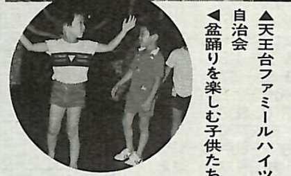
▲天王台ファミリーハイイツ自治会