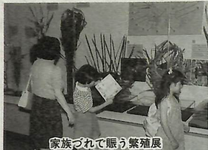
家族づれて賑う繁殖展

鳥たちの「子育て」をテーマにした企画展が、鳥の博物館2階企画展示室で開催され、人気を呼んでいます。手賀沼で聞き慣れた鳥の声が響きます。