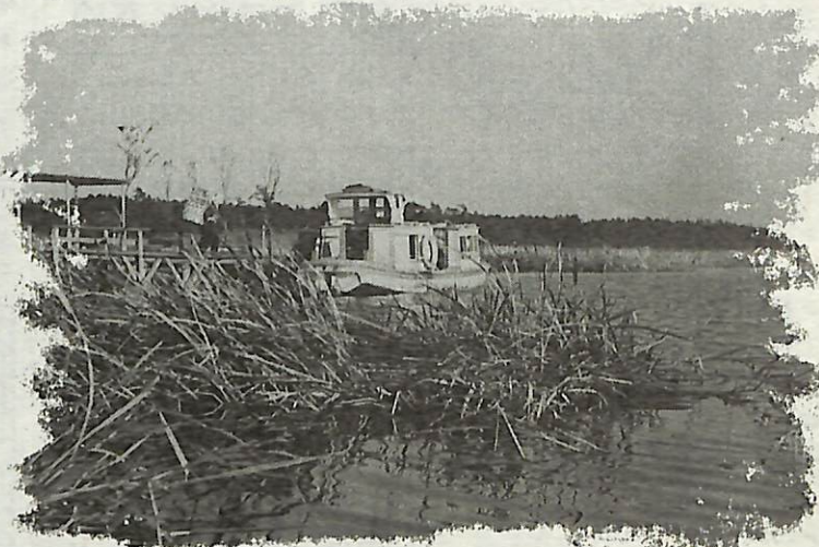
昭和38年ごろの手賀沼の渡し

昔の思い出の写真から当時の手賀沼を振り返ってみませんか。(このシリーズでは毎月1日号で連続掲載します)