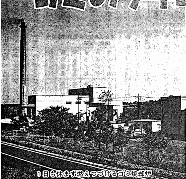
1日も休まず燃えつづけるゴミ焼却炉