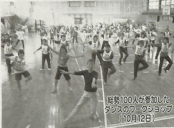
総勢100人が参加したダンスのワークショップ (10月12日)