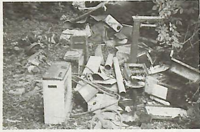
▲後を絶たない不法投棄

全国各地でゴミの不法投棄が大きな社会問題になっていきます。市内でも、年末は特に、山林や農地への不法投棄が懸念されます。 市では、日中と夜間のパトロールを強化し、不法投棄やポイ捨て防止に努めます。