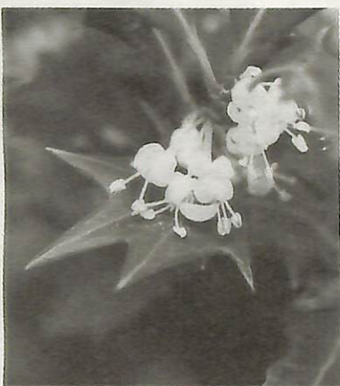
ヒイラギ (もくせい科)

十一月の末に根戸新田の水神社を訪れると、ヒイラギが白い花をつけていました。 花は晩秋に咲き、十二月頃まで残ります。ヒイラギには雄の木と雌の木があり、七月頃、雌の木に黒く熟した実がみられます。ヒイラギの葉の縁は鋭い刺状となり、葉の刺が皮膚にささるとひりひり痛みます。