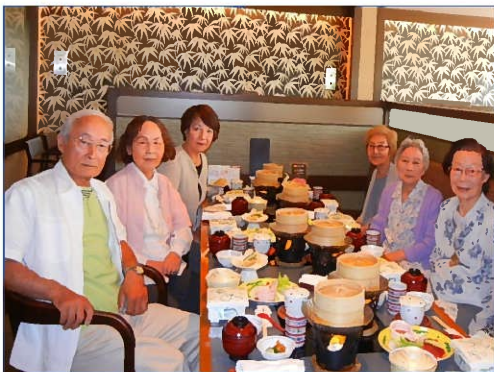
ご高齢の方とのレストランでの外食と団欒