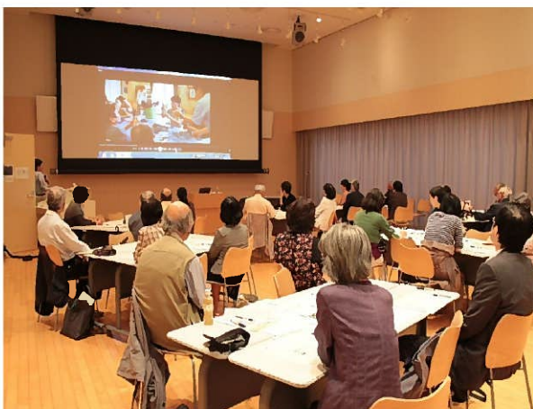
講演会・ワークショップ