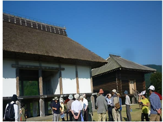
* 平成28年10月史跡見学会 「つくば市の古代から現代までを訪ねる」 平沢官衙跡(復元倉庫)