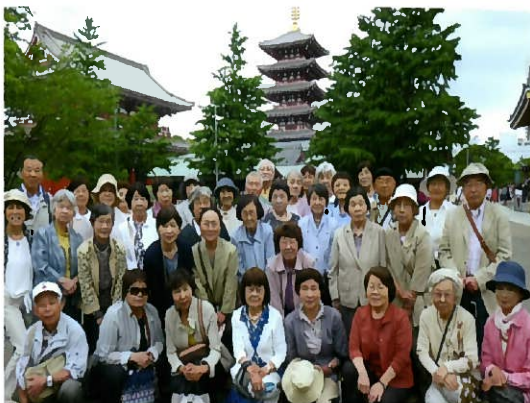
研修バス旅行 情報交換をしました。29年6月