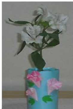
フラワーセミナーの作品