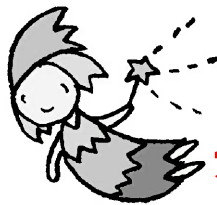
妖精「あびかる」ちゃん