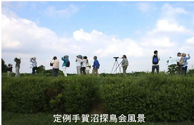
定例手賀沼探鳥会風景

自然のなかの野鳥を楽しみ、野鳥を愛するところを育てる活動を行い、野鳥を通じて自然保護に努め、人と鳥が共存する環境づくりを行い、あわせて会員の親睦を図ることを目的としています。