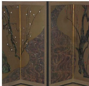
尾形光琳作「紅白梅図屏風」