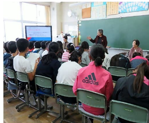
学校でも認知症の授業

ここ数年は「認知症でも安心して暮らせる地域を作ろう」の活動と悪質商法にかからないための啓発活動を続けています。