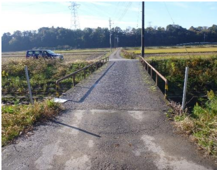
現地写真（正面写真）