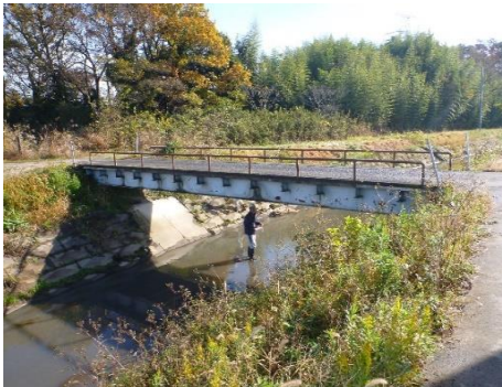
現地写真（側面写真）